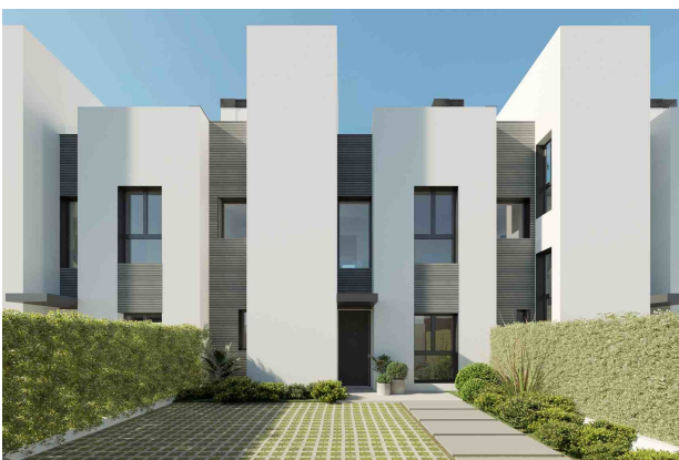
Parkplätze / Eingang (Rendering)