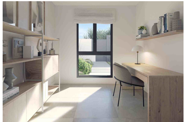
Büro / 4. Schlafzimmer (Rendering)