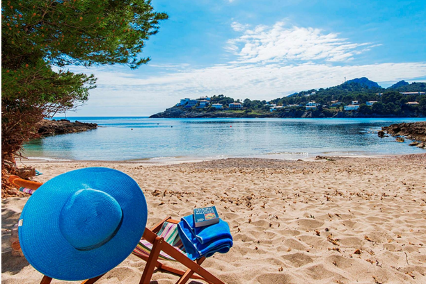
Strand in der Nähe