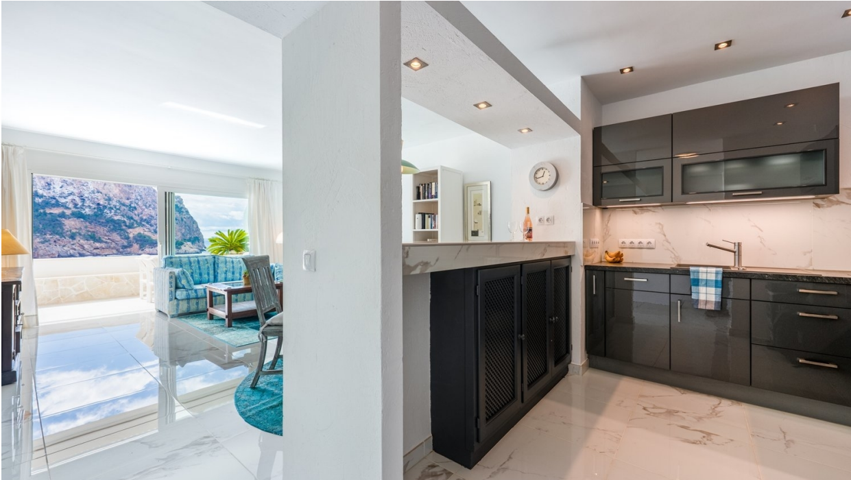
Küche / Wohnen