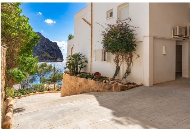
Ausfahrt / Parkplatz