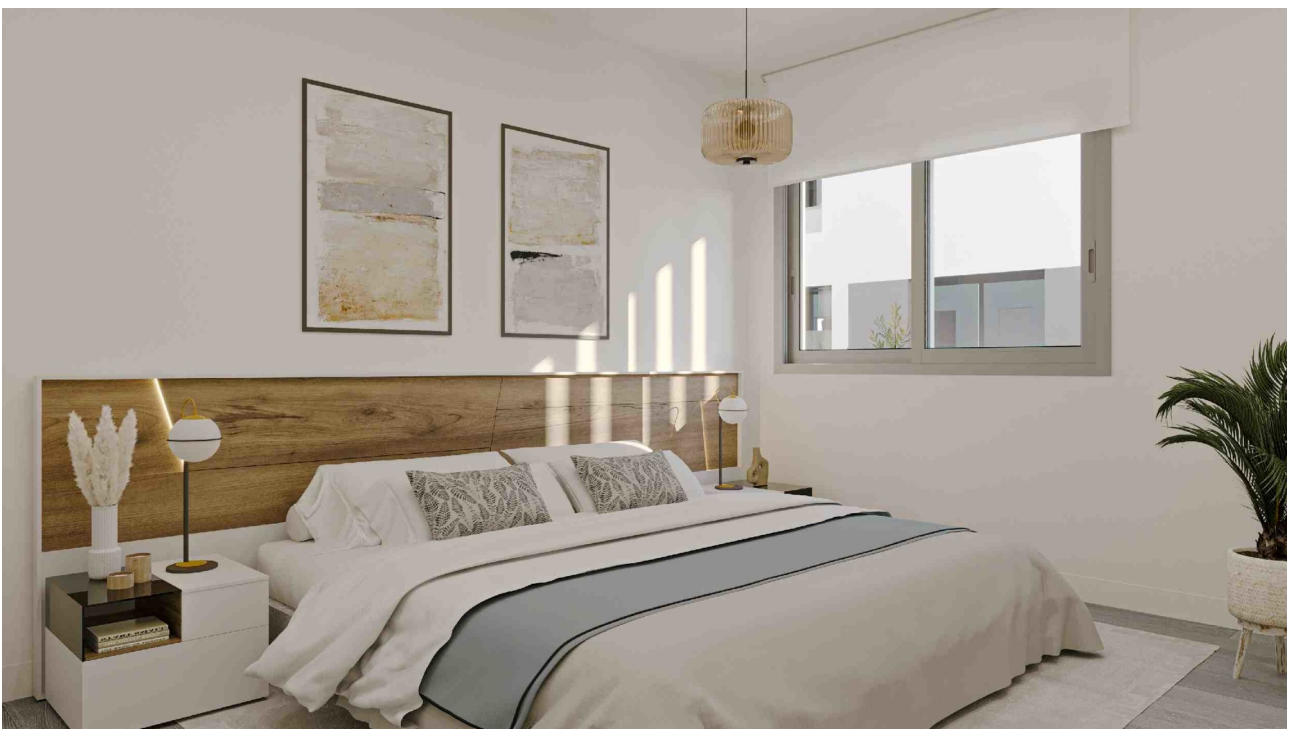
Schlafzimmer 2 (Rendering)