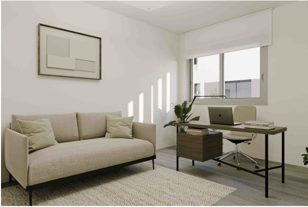
Schlafzimmer 3 (Rendering)