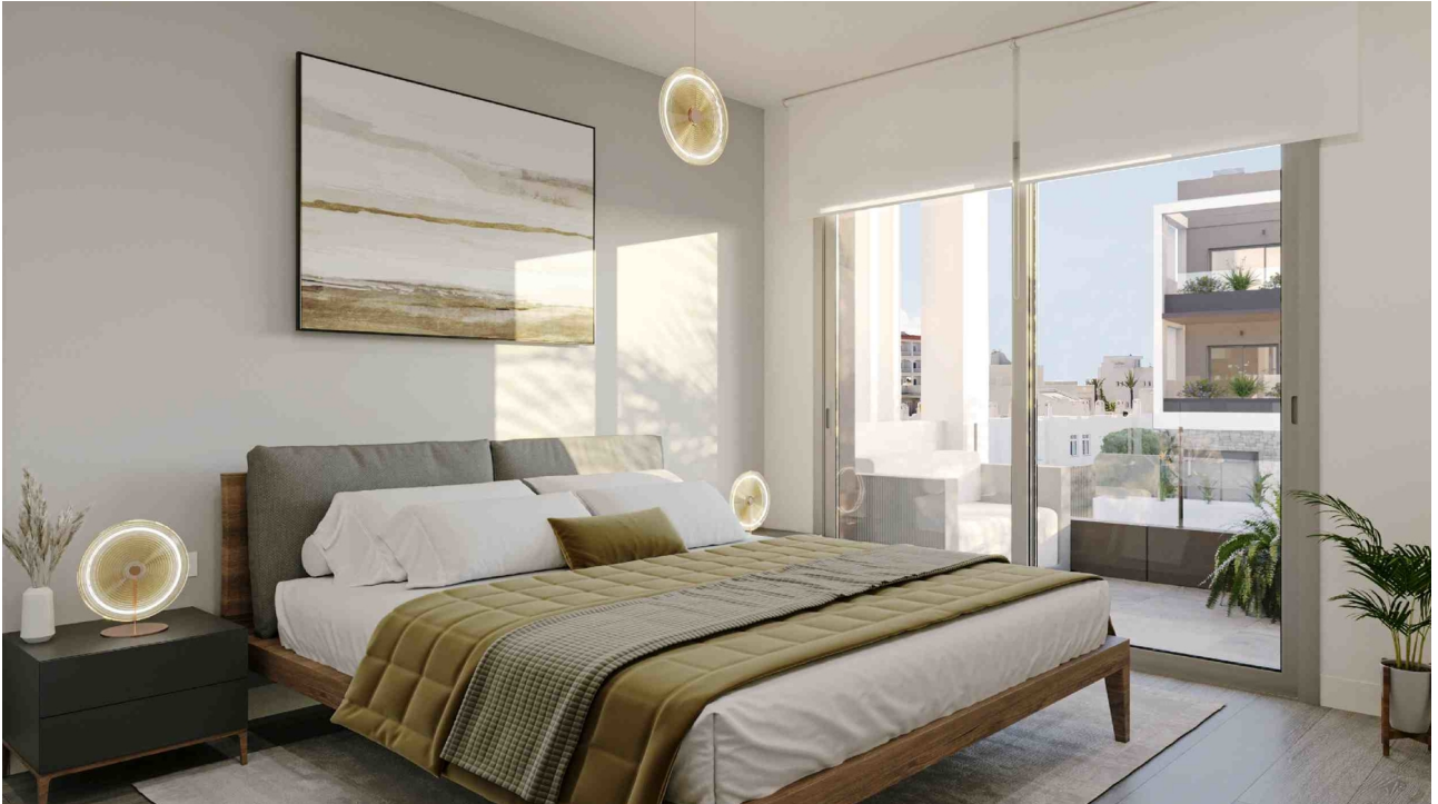
Schlafzimmer 1 (Rendering)