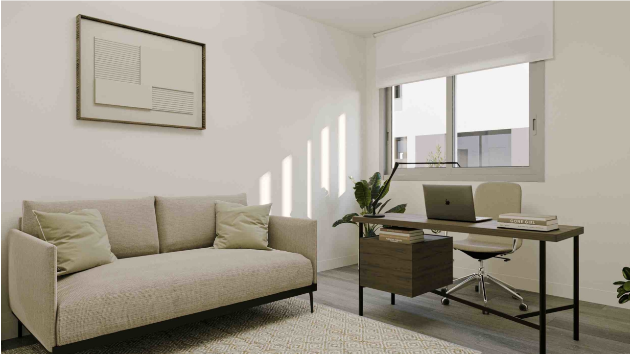
Schlafzimmer 2 (Rendering)