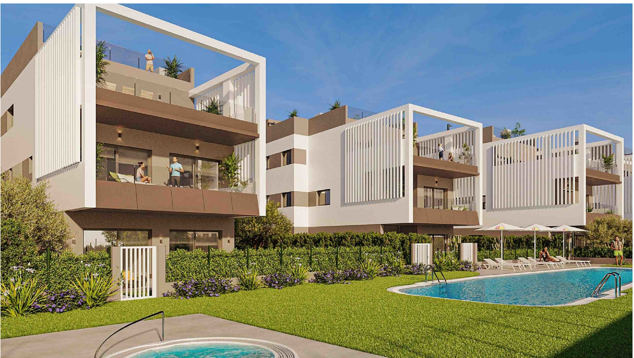
Swimmingpool Gemeinschaft (Rendering)