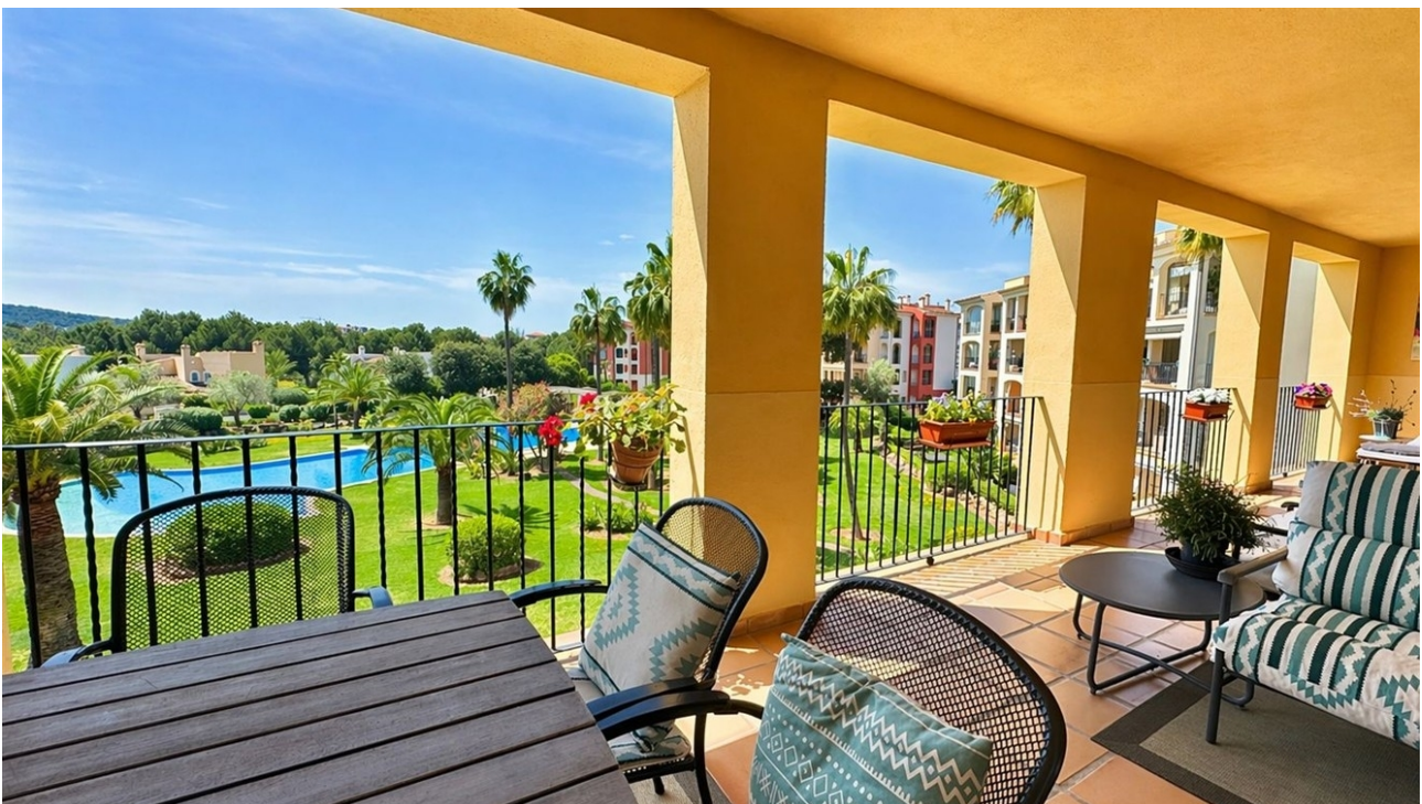
Grosse Süd Terrasse