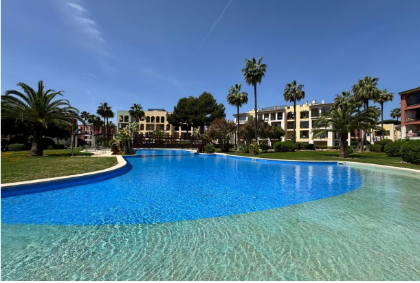
Mallorca kaufen Wohnanlage