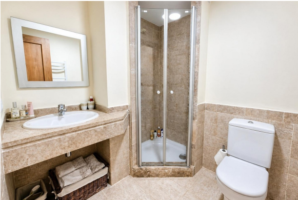
kaufen Wohnung Mallorca