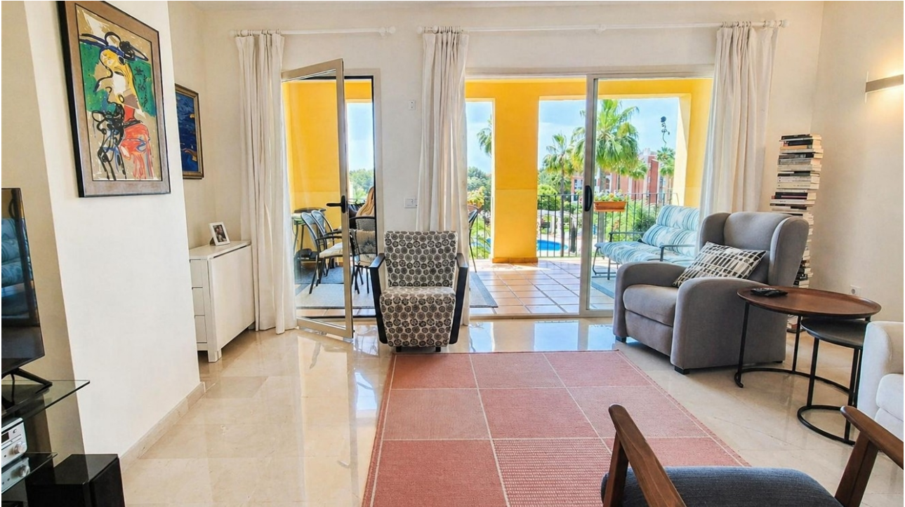
kaufen Wohnung Mallorca