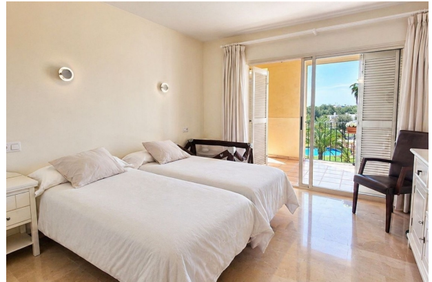
kaufen Port Adriano