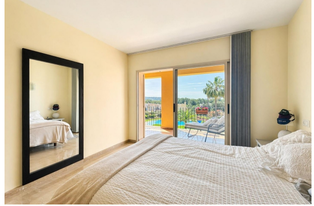
Golfplatz Wohnung kaufen