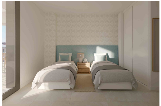
Dormitorio 2 (Rendering)