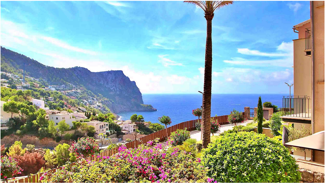
Vista al mar