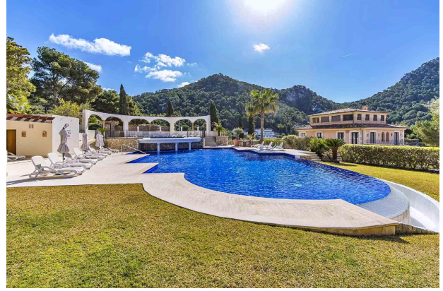
Piscina A (Comunidad)