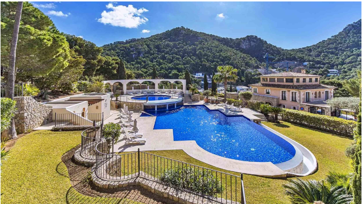
Piscina A (Comunidad)