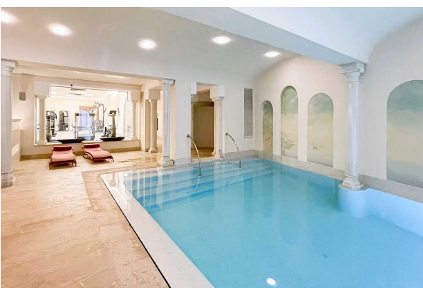
Piscina B (Clubhouse)