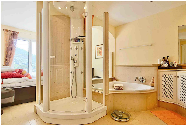
Bano en Suite