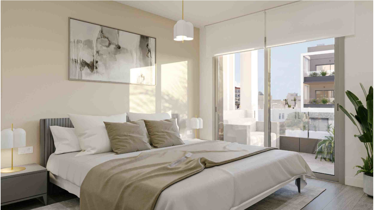
Dormitorio 1 (Rendering)