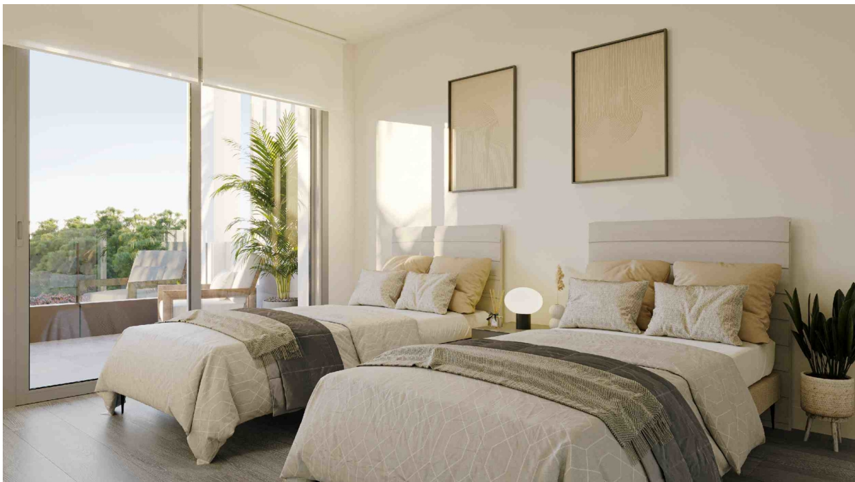
Schlafzimmer 1 (Rendeirng)