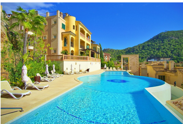
Piscina 2 (Comunidad)