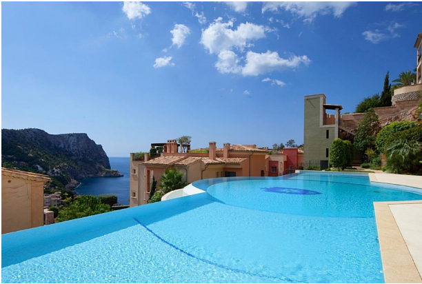
Piscina 2 (Comunidad)