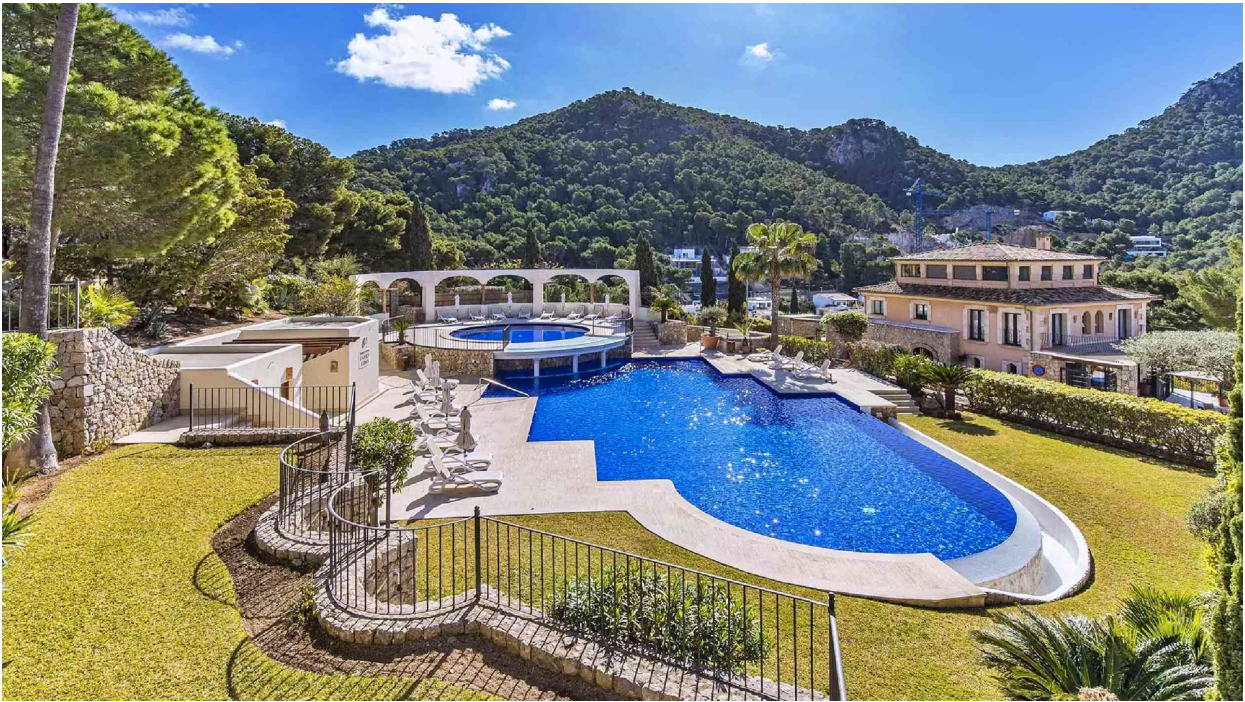
Piscina 1 (Comunidad)